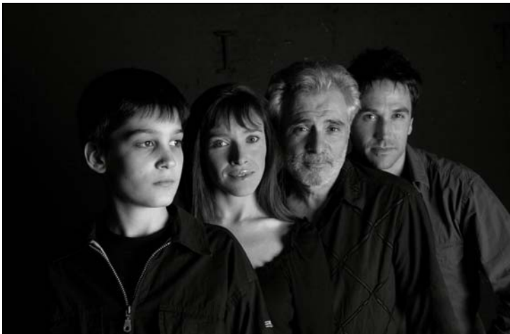
J.R.S., de dotze anys

Així mateix, el text d'Octavi Egea ha estat publicat a la col·lecció Columna-Romea de teatre.